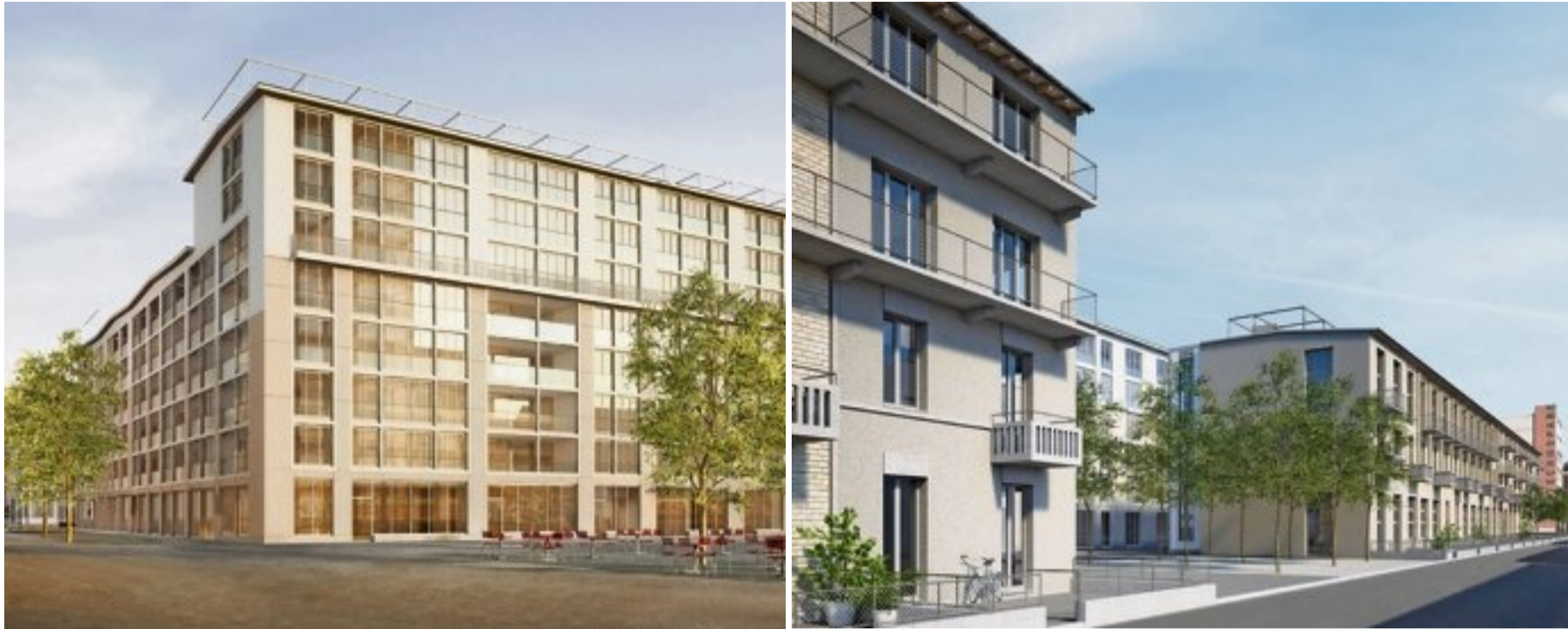
Das Siegerprojekt von Baumberger & Stegmeier Architekten und Kilga Popp Architekten beinhaltet Wohnungen inmitten des Areals (links) sowie Stadthäuser entlang der Jägerstrasse.